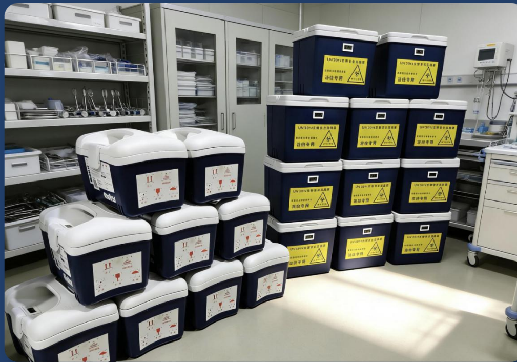
标准化定制标识示例：医疗运输箱实物展示