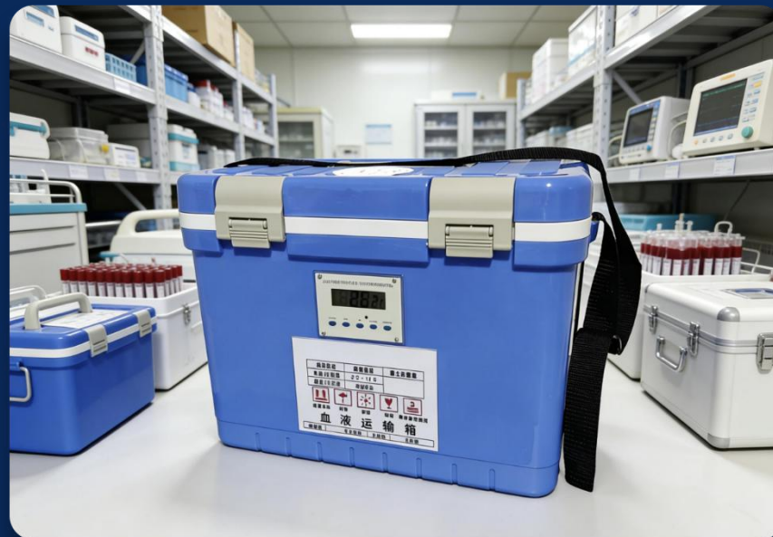
专业医疗冷链运输设备示意