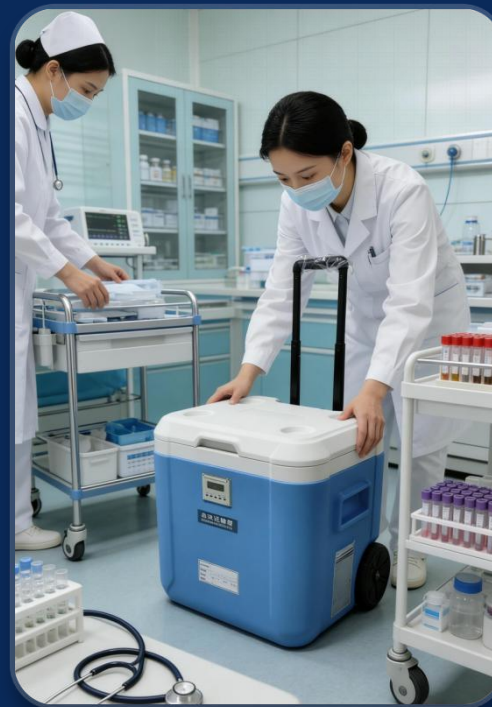
医院临床血液运输场景