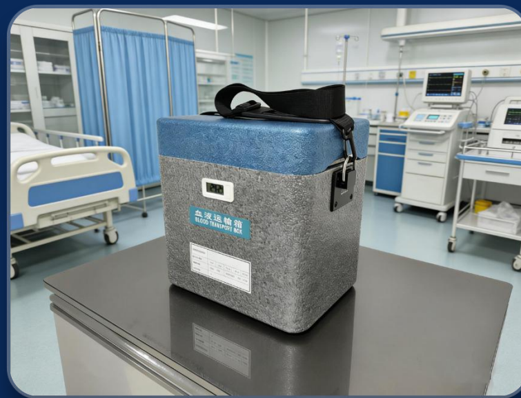
专业生物样本运输箱